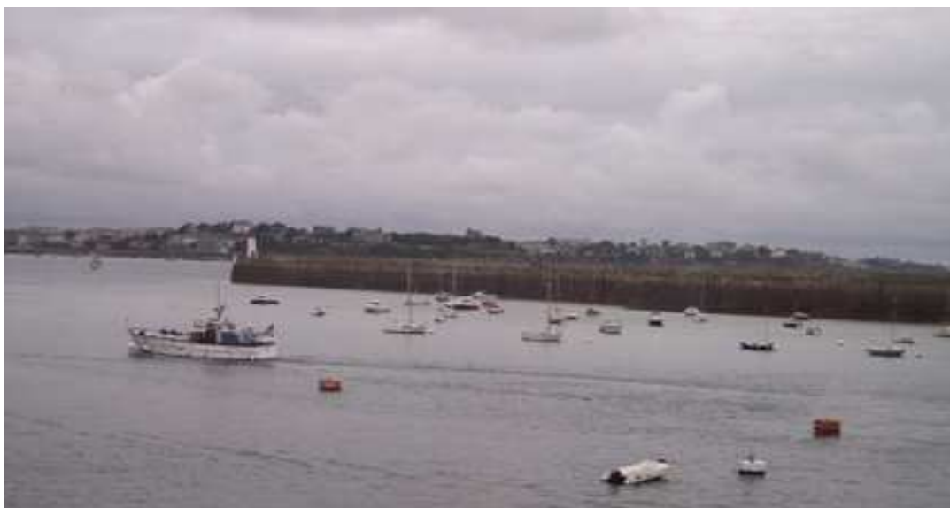
Le lieu d'accueil privatisé offre une vue panoramique sur l'avant-port de Saint-Malo